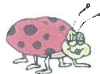
בְּבִיבָה אֶמְלֵקָה בְּבִיבָה