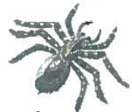
בְּבִיבָה אֶמְלֵקָה בְּבִיבָה